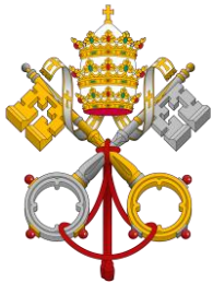
Wappen des Hl. Stuhls

Verlag und Buchdruckerei J. Steinbrenner