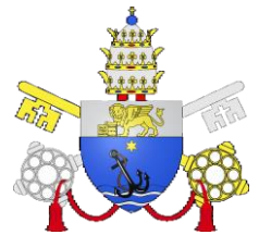
Wappen Pius X

Verlag und Buchdruckerei J. Steinbrenner